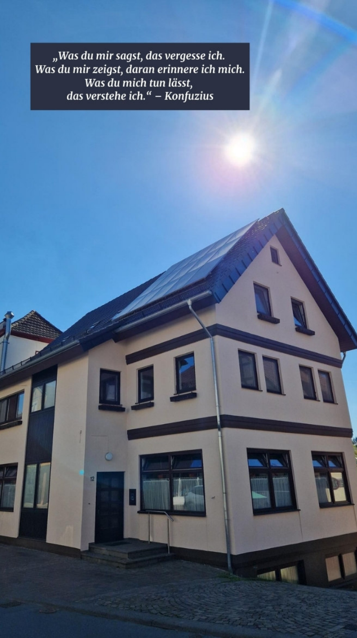
Das DRK-Apartment-Haus in der Stadtmitte von Buchen

„Was du mir sagst, das vergesse ich. Was du mir zeigst, daran erinnere ich mich. Was du mich tun lässt, das verstehe ich.“ – Konfuzius