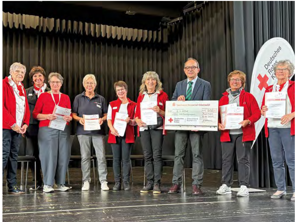
Bei der Jubiläumsfeier in der Stadthalle wurden langjährige Übungsleiterinnen, Gruppen der ersten Stunde und Teilnehmer geehrt.